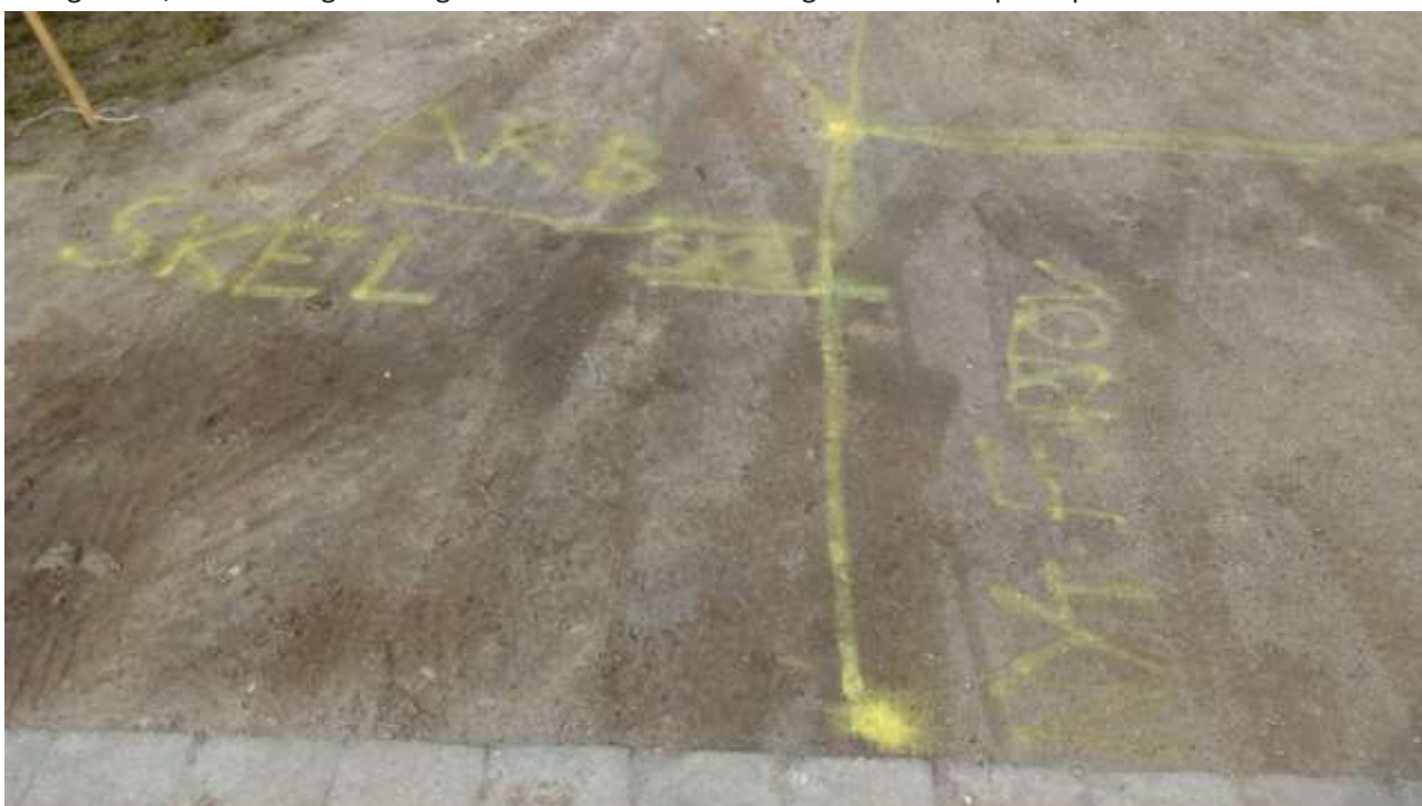
Foto nedenfor: Til højre ses området, hvor ansøger ønsker at afslutte fortovet, markeret med en tværgående, horisontal gule streg. Til venstre herfor vil ansøger lave vendeplads på AKB's matrikel.

Vendeplads for renovationskøretøjer må tilvejebringes ved at det nuværende vejudlæg udvides på matrikel 123b's areal, for eksempel ved at den foreslåede bebyggelse rykkes mod syd, uanset at dette måtte betyde at bebyggelsens omfang må reduceres. (Se også punktet "bygningshøjder").