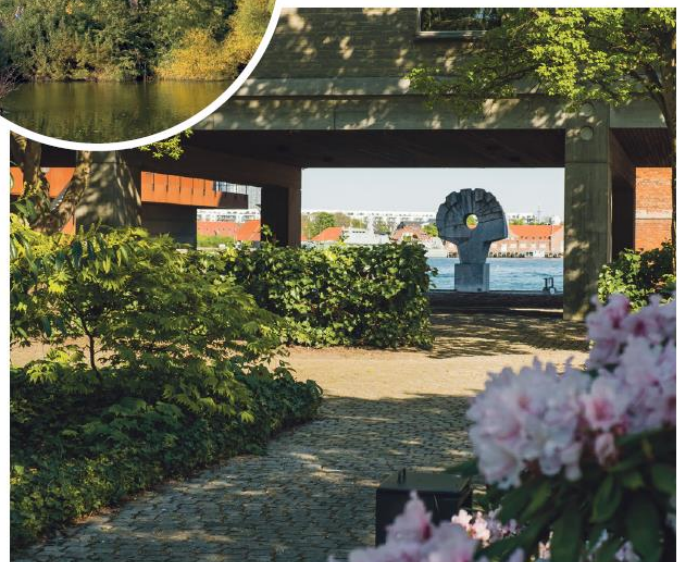
Heerup Haven bag Energistyrelsen på hjørnet af Amaliegade og Toldbodgade? Fra »Stille København« af Peter Olesen.