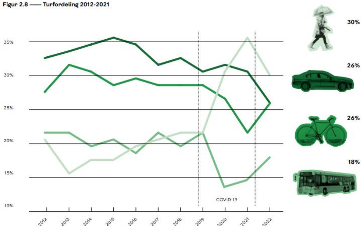
Figur 2.8 — Turfordeling 2012-2021