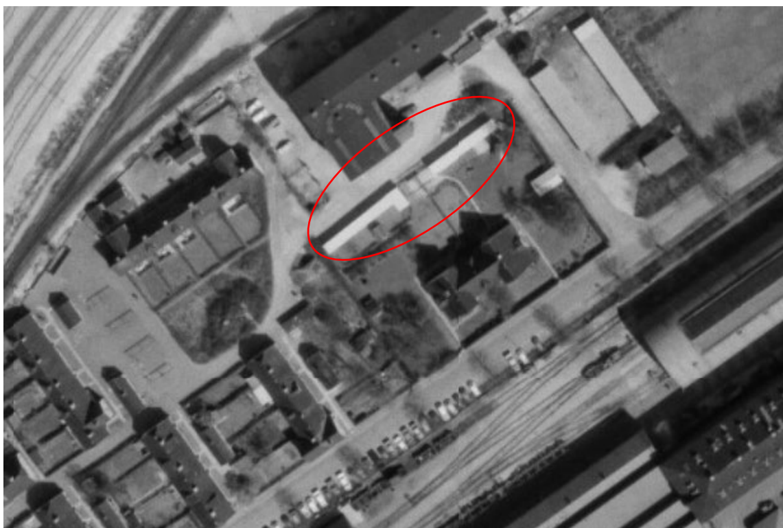
Billede fra det Kongelige bibliotek fra 1971

Beboerne i Den Gule By har meget lidt opbevaringsplads inde i de små huse (ingen kælder eller loft) og derfor byggede DSB rækken med grønne træskure til beboerne, så de kunne opbevare cykler, haveredskaber, havemøbler etc., nogle af beboerne brugte dem endda til hønsegårde. Disse skure har en stor betydning for beboerne, da de ellers ikke har andre muligheder for opbevaring. Skurene har ligget i Den Gule by siden 1960'erne og har været benyttet af beboerne lige siden. Disse vil jo forsvinde, hvis rækkehusene skal bygges. Hvis skurene bliver revet ned, får beboerne ikke tilbudt anden opbevaringsplads til de ting de i dag har i skurene. Desuden fungerer skurene også som en vigtig indhegning af haverne ved mesterboligerne. Hver af de små boliger har et gult skur i deres kontrakt, men disse bruges ofte til opbevaring af objekter, som skal ligge i et tørt rum, såsom kufferter, tøj, møbler, dokumenter etc. Disse var gule udhuse var oprindeligt tiltænkt vask af tøj og var indrettet med gruekedler og der var plads til brænde/koks.