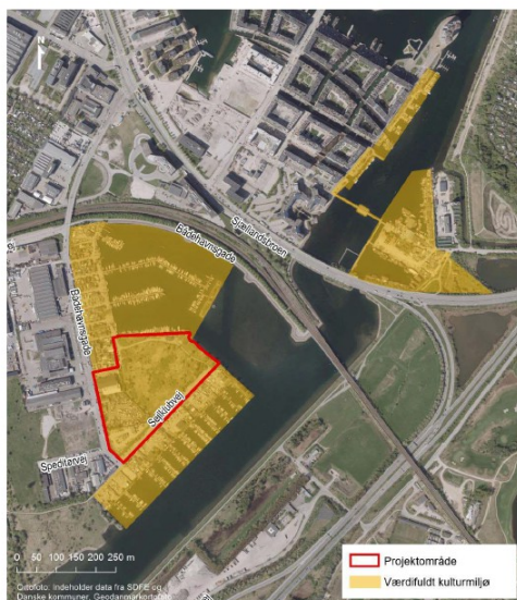
Figur 17-1 Udpegning af kulturhistorisk miljø fra Københavns Kommuneplan og projektområde.

COWI viser billedet i retoucheret udgave og glemmer at medtage Fiskerhavns selvbyggeri som bevaringsværdigt, når de bringer dette kort i Miljørapport for lokalplan Stejlepladsen og kommuneplantillæg (side 46). Dette på trods af, at miljørapporten selv understreger dette forhold (side 188).