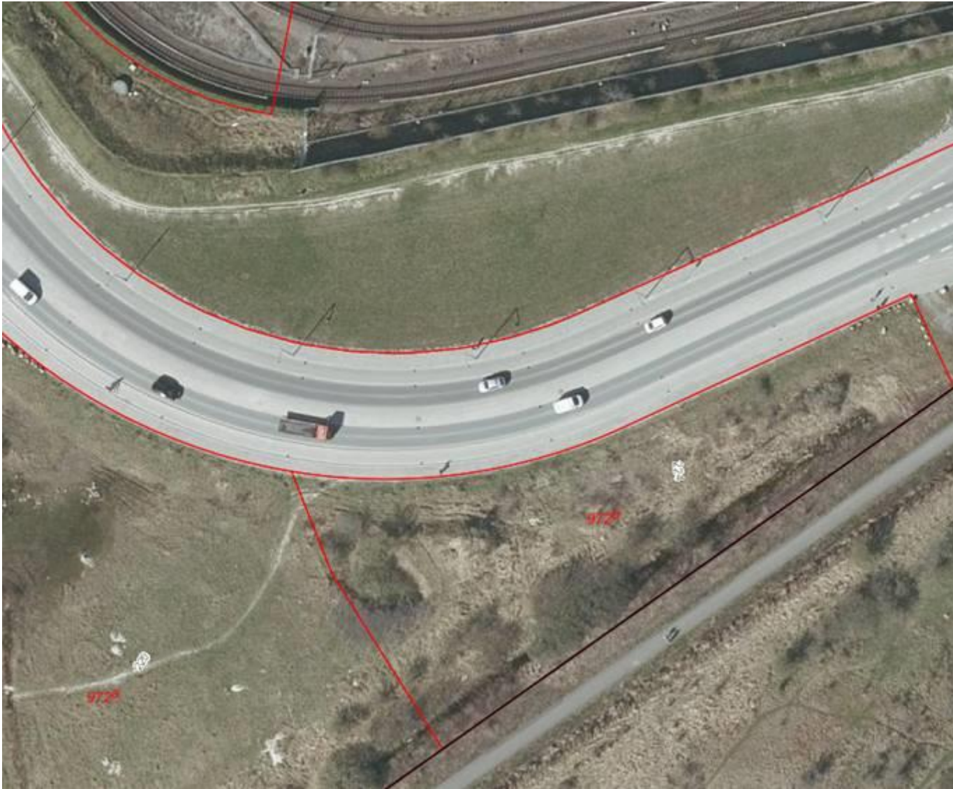
Eksisterende forhold