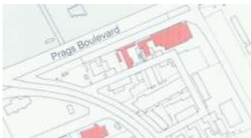
Udsnit af kort fra Bydelsatlas Amager, 1992, side 65.

Nedenstående viser hvilke bygninger, der blev udpeget i lokalplanområdet i forbindelse med Bydelsatlas Amager fra 1992. Her ses det, at de fleste bygninger slet ikke blev registreret og således blev der ikke taget stilling til bevaringsværdierne.