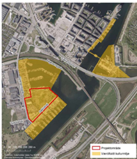
Figur 17-1 Udpægning af kulturhistorisk miljø fra Københavns Kommuneplan og projektområde.

(side 46). Dette på trods af, at miljørapporten selv understreger dette forhold (side 188).