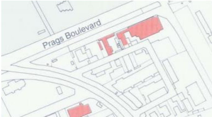
Udsnit af kort fra Bydelsatlas Amager, 1992, side 65.

Området er udbygget kraftigt fra 1950'erne med småindustri og det præger fortsat området. Lokalplanområdet rummer tidstypiske industribygninger fra 1950-60'erne og dens lidt rodede, rå og sammensatte disponering understreger denne tidstypiske karakter. Museet savner en kulturhistorisk dimension i lokalplanforslaget. Med forslaget forsvinder endnu en del af den københavnske småindustri til fordel for boliger. Industribyggeriet omkring Yderlandsvej er en del af den nyere Københavnske historie, men det gør den ikke uvæsentlig at bevare.