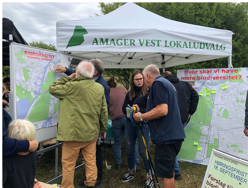
Fra Fælledens Dag 11.9.22

Her på den korte bane deltog lokaludvalget i orienteringsmødet d.1. september og borgermødet d.13. september 2022.