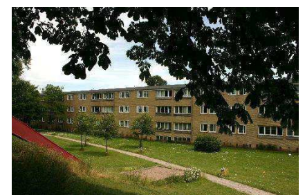
Terrænforskelle i haverum