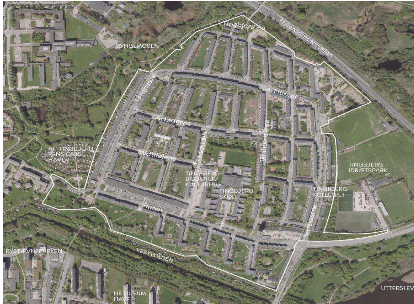
Luftfoto af Tingbjerg med lokalplanafgrænsningen markeret med hvidt.

Vejbetjening sker med et net af veje, der via et ringvejssystem (Ruten-Terrasserne-Gavlhusvej-Langhusvej) er koblet til det overordnede vejnet. For at undgå en monoton bydel har Steen Eiler Rasmussen søgt at gøre vejene så karakterfulde som muligt. Dette er løst ved at differentiere gadenettet, så hver vej og gade er udformet efter sin specielle placering og funktion inden for området, og ved at vejene krummer.