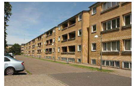
Facader mod gade med opdeling i mindre enheder