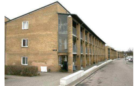
Arkadernes kurvede forløb set mod vest