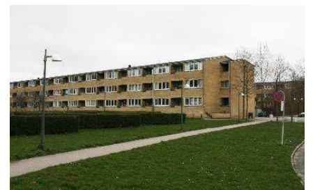
Facade mod have