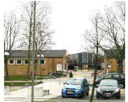
Skolen set fra Ruten

C. Th. Sørensens landskabsplan for Tingbjerg fremhæver bebyggelsesplanens store linjer og træk i Tingbjerg, der i dag også kan genkendes i bebyggelsen. Hovedideen var at skabe de bedste forudsætninger for et socialt liv udenfor både for børn, unge, voksne og ældre med hver deres behov. Det var C. Th. Sørensens idé, at børn og voksne skulle have adgang til de samme landskabstyper, som man kender fra landet: Sandstranden, engen og lunden. Landskabstyperne stiliseres til sandkasser, til græsplæner og til beskyttende og skyggegivende beplantninger. Med randbeplantning, træækker og plateauer og terrænbearbejdning