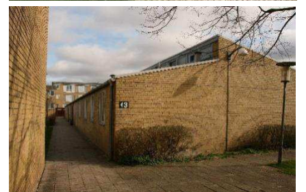
Institutionsbygninger i 1 etage og med forskudte tage