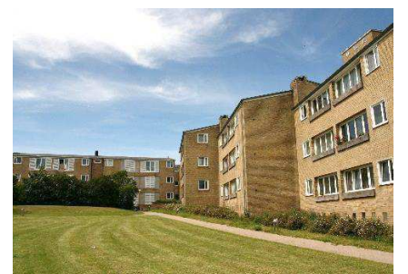
Haverum med facader der fortanner