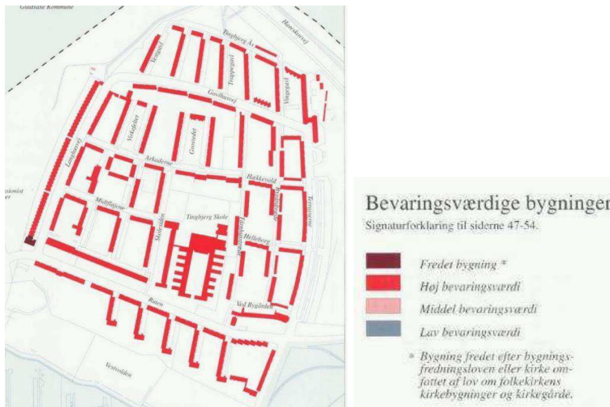
Kort: Bydelsatlas Brønshøj-Husum