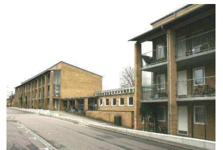
Arkaderne mod øst med en 1-etages institution

Tingbjerg er opført på grundlag af en bebyggelsesplan udarbejdet i 1950 af Arkitekt Steen Eiler Rasmussen i samarbejde med havearkitekt C. Th. Sørensen. I 1956 påbegyndtes byggeriet og størstedelen af bebyggelsen var færdigopført i 1970. I 2018 er der opført et kulturhus tegnet af arkitektfirmaet COBE. Bygården mod Ruten stod i medio 2020 færdigbygget med butikker og private boliger på det førhenværende Lille Torv.