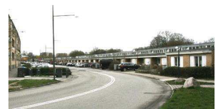
Rækkehuse ved Langhusvej