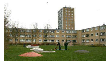
Højhuset set fra sydvest