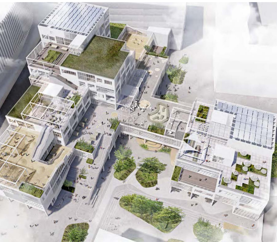
Rendering af Skolen på Hannemanns Allé. Mere end halvdelen af skolens udearealer er placeret på bygningens tage, som haver og terrasser, på grund af skolens begrænsede matrikelstørrelse. Rubow Arkitekter (fra høringsmaterialet).