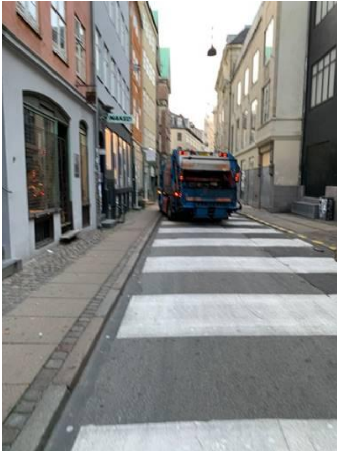
Foto 1. Lastbiler kører op på fortovet

Ad 2. Jeg har et spørgsmål til din besvarelse ”Baggrunden for at det kun er Moviabusser der har tilladelse til at køre gennem Gammeltorv/Nytorv, er for at sikre, at der ikke sker gennemkørsel af indre by fra Nørreport til Stormgade/Vindebrogade. Hvis denne trafik blev gjort lovlig, ville der komme en stigning i antallet af køretøjer på strækningen, hvilket vi ikke finder hensigtsmæssigt, ikke mindst da antallet af fodgængere og cyklister er væsentligt større på Gammeltorv/Nytorv end i Klosterstræde”.