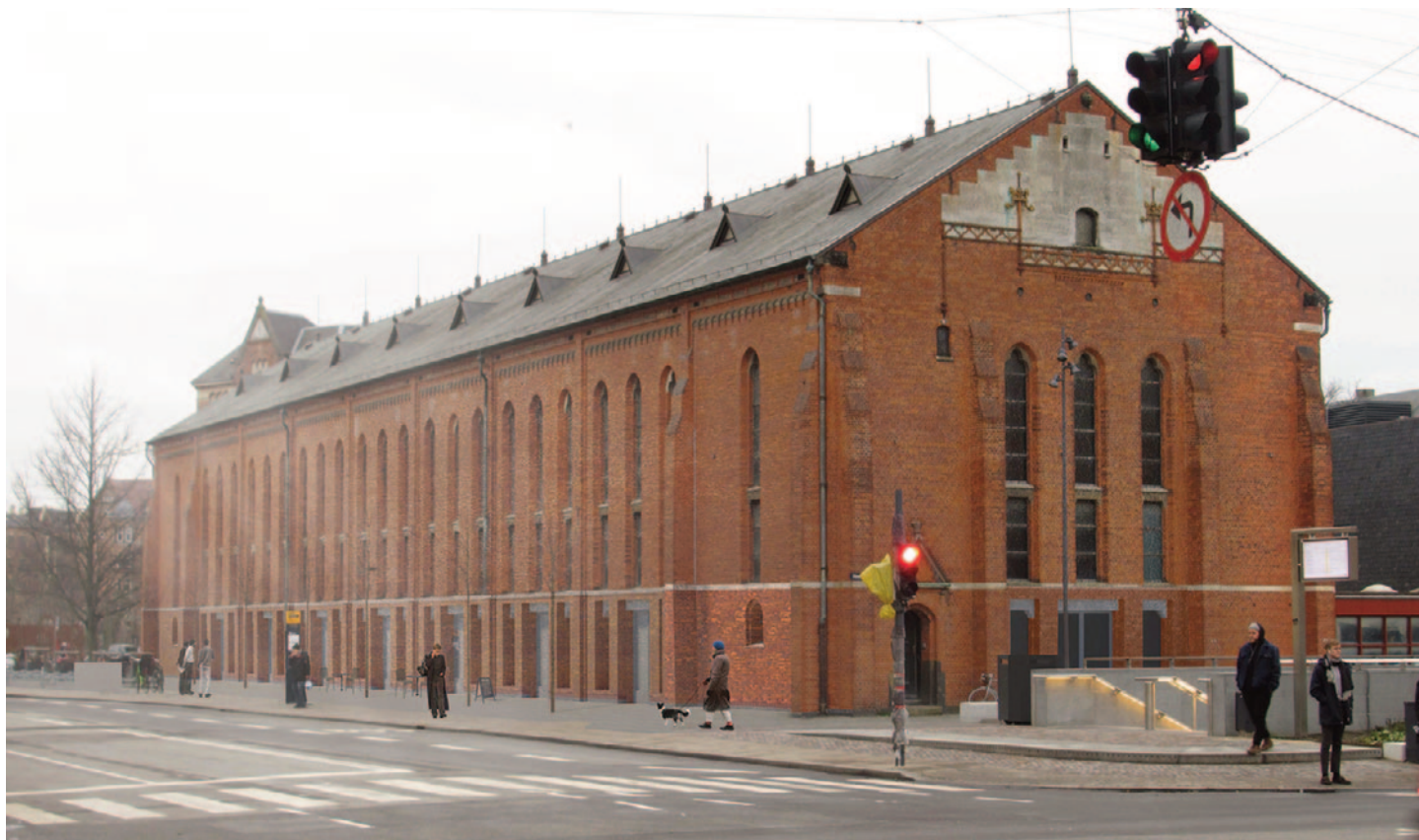
Landsarkivets facade mod Rantzaugade som den kunne blive ... uden "borggittervinduer"