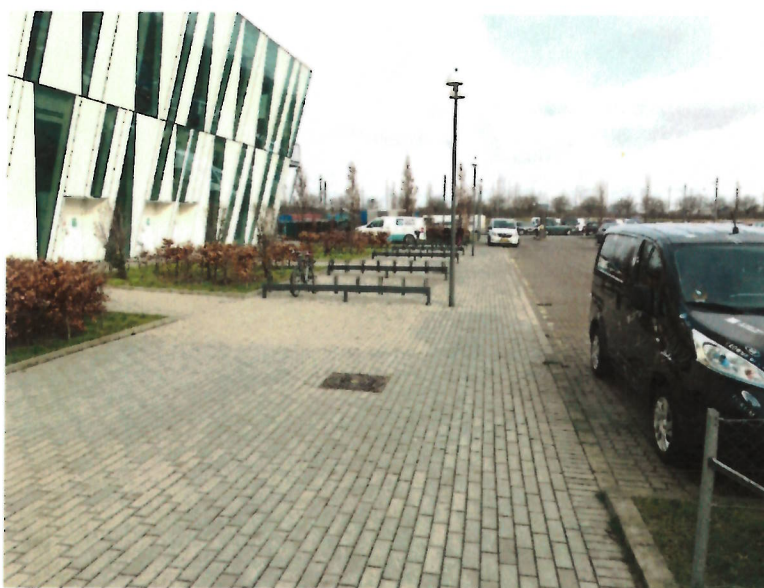
Foto: Eksempel på tomme cykelparkeringspladser, hvor der i stedet kunne være placeret mere aktive byrumsfunktioner. Foto er fra 2018 og er taget ifm. afholdelse af Lego World.

Det er ganske få gange om året at der kan forventes mange cykler i området. Resten af tiden vil byrummene ikke fremstå attraktive eller anvendelige med mange tomme cykelparkeringspladser, som illustreret nedenfor.