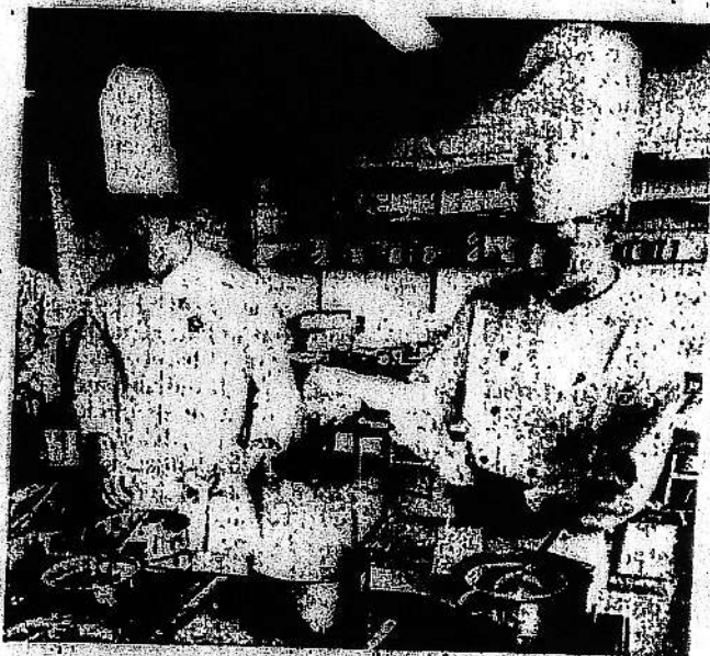
GIFT UNDER GRYDERNE - Hotel- og Restaurantsskolen vil gerne bygge nye undervisningslokaler, men på et møde onsdag fik man at vide, at det har lange udsigter med en byggetilladelse. Først skal forureningen på den gamle gasværksgrund undersøges til bunds, og derefter skal det afgøres, hvor meget af jorden der skal graves væk

Oprindelig var der afsat 400 millioner kr. til oprydningen, og de fleste af disse penge er nu brugt. I de seneste vurderinger tales der imidlertid om et beløb, der er over ti gange så stort - 6-8 milliarder kr. - og de penge er ikke tilvejebragt.