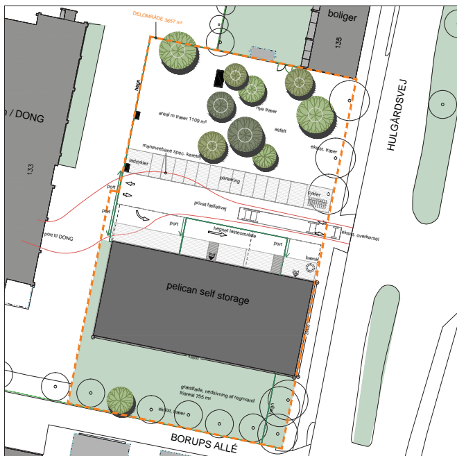
Ud over et opholdsareal skaber pladsen afstand til naboerne

Generelt er det vigtigt, at arkitekturen understøtter de mange tiltag, der er foretaget for at tilføre stedet et løft, med kvalitet i de arkitektoniske løsninger og identitet, samt fokus på kvaliteten af de ubebyggede områder. Byggeriet er i overensstemmelse med Københavns Kommunes ønske om miljørigtig byggeri. Mere specifikt vil der i det videre arbejde blive fokuseret