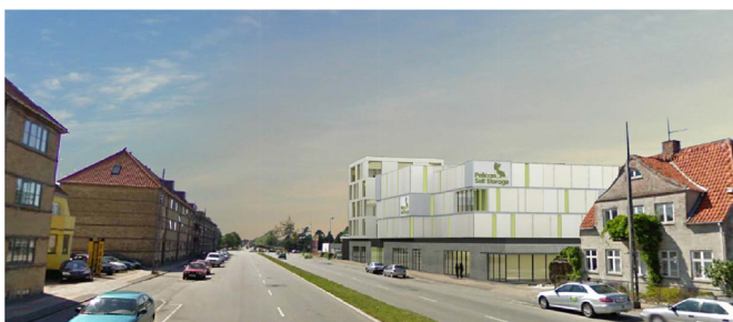
View fra Roskildevej - Delareal 1 og 2. Illustration Skovhus Arkitekter.