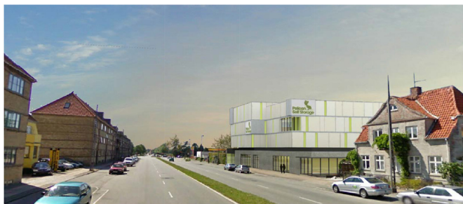
View fra Roskildevej - Delareal 1. Illustration Skovhus Arkitekter.