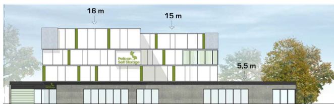
Facade mod Roskildevej. Illustration Skovhus Arkitekter.