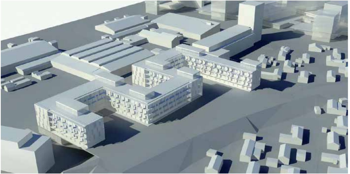
3D- model af det aktuelle projekt set mod nord. Illustration: Tegnestuen Vandkunsten.