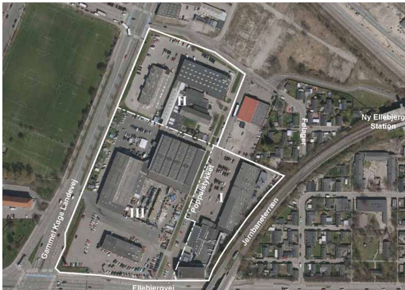
Lodfoto af området og dets omgivelser. Lokalplan området er vist med hvid bræmme. Lokalplanområdet indgår i et større byomdannelsesområde, som omfatter Ny Ellebjerg Station, Grøntorvet, F. L. Smidth m.v.

Lokalplanområdet indgår i det store byudviklingsområde "Ny Ellebjerg-området" og "Grøntorvsområdet", for hvilke der er vedtaget lokalplaner og nye lokalplaner er på vej. Poppelstykket vil blive et vigtigt bindeled fra stationen til Valby Idrætspark.