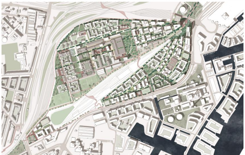
Luftfoto og plantegning fra Team Cobes forslag til helhedsplan