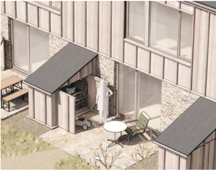
Illustration af mulig udformning af skur på haveside