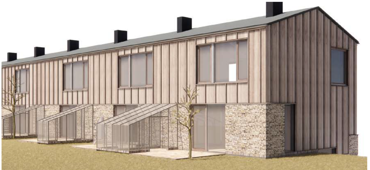
Illustrationer af fra udviklingen af Lokalplan 609 der viser principper for den lokalplanlagte udformning af drivhuse