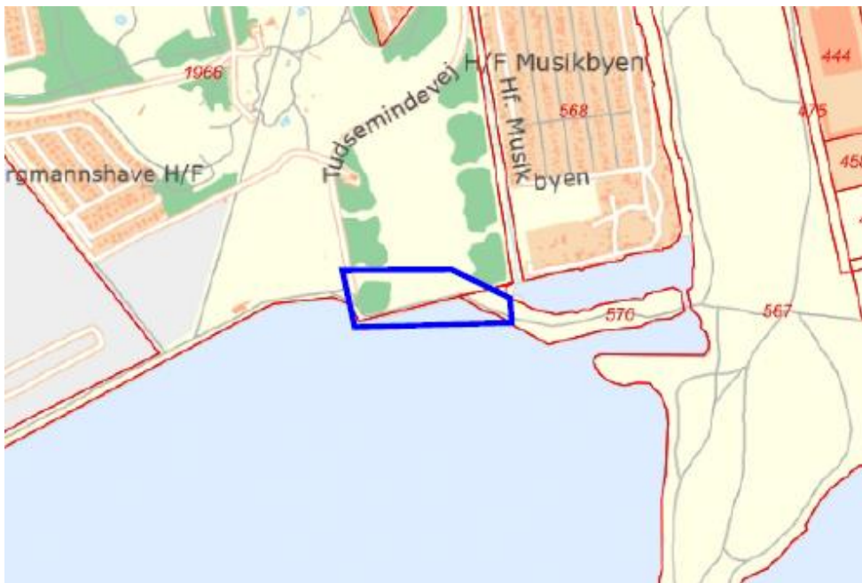
Billede af hvor projektet placeres med blåt.

Naturstyrelsen gav 10. december 2014 dispensation fra strandbeskyttelseslinjen til projektet, jf. sag nr. NST-4132-101-00014.