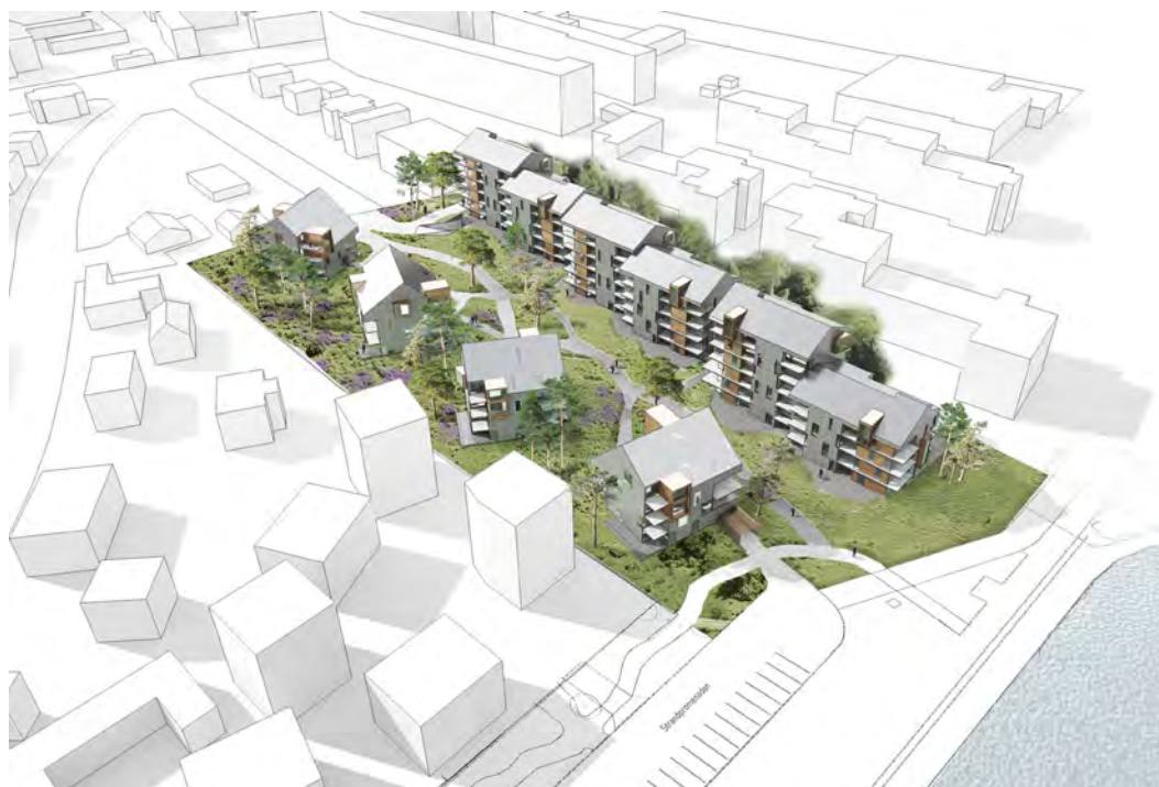
Illustration af den foreslåede boligbebyggelse set fra luften og mod vest. De fire flerfamilievillaer i form af punkthuse er beliggende tættest mod det eksisterende villakvarter og den kommende boligbebyggelse ved Strandpromenaden, og bygger således videre på denne bebyggelsesstruktur. De tre blokke er beliggende mod nord og Gentofte, hvor der er muligt store boligblokke i op til 37 meters højde.

En realisering af det aktuelle projekt forudsætter en ændring af kommuneplanens rammebestemmelser, da fordelingen mellem boliger og serviceerhverv ændres. Det foreslås derfor, at det nuværende C1-område opdeles i to nye rammer. Opdelingen foretages, så den aktuelle ejendom, naboejendommen mod vest og det nyplanlagte boligområde ved Strand-