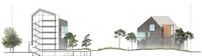
Snit fra syd til nord i bebyggelsen, der viser etagerne i en boligblok samt facaden på et af punkthusene. Man kan ligeledes se parkeringskælderen under bebyggelsen.

Bebyggelsen etableres i et åbent parklandskab uden hegning, så der sikres sammenhæng til de rekreative arealer langs Svanemøllebugten. Der etableres en sti med offentlig adgang gennem bebyggelsen med forbindelse fra Strandvejsområdet via Scherfigsvej til Strandpromenaden.