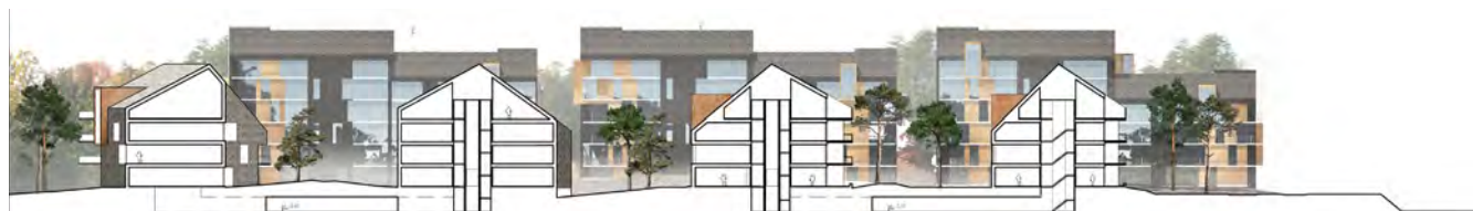
Længdesnit fra vest til øst, der viser etagerne i punkthusene samt facaderne på de bagvedliggende boligblokke. Mellem punkthusene etableres to parkeringskældre, der servicerer to punkthuse hver.