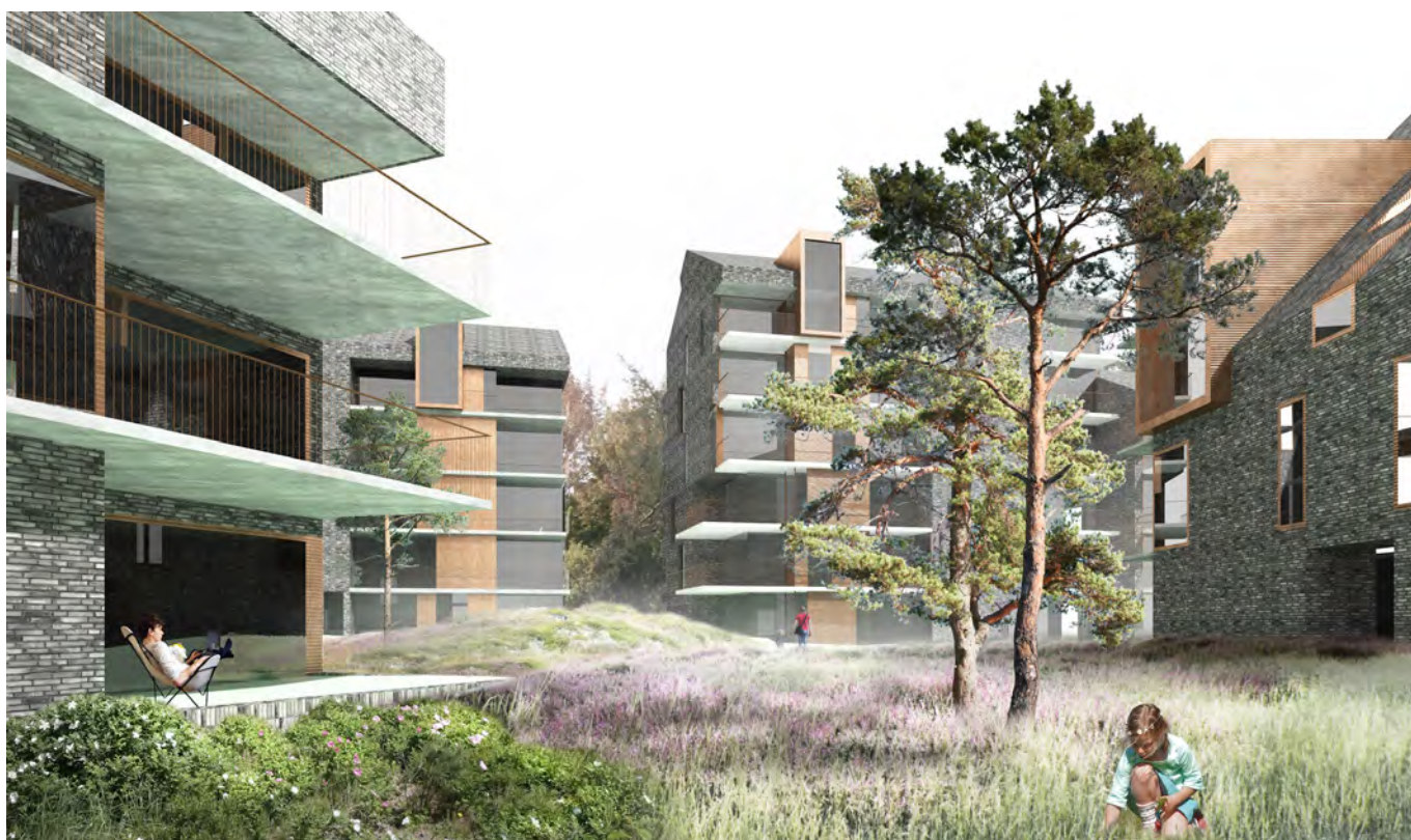
Et kig ind i bebyggelsen mellem to punkthuse over mod et af mellemrummene mellem boligblokkene. Landskabet foreslås lettere kuperet og udlagt som strandeng.