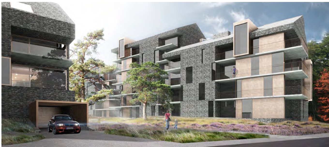
Et kig fra Strandpromenaden ind i bebyggelsen. Man aner den offentligt tilgængelige sti, der sikrer forbindelse til Scherfigsvej.