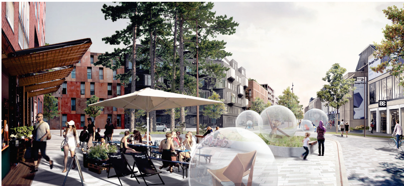
Visualisering af et byrum ved den østlige side af Bella Centeret. Byrummet fungerer også som udstillingsrum. Ill. af COBE.

Valg af farver, bebyggelsesform og beplantning skal optimere boligernes lysforhold og bidrage til et mikroklima egnet til ophold i byens rum.